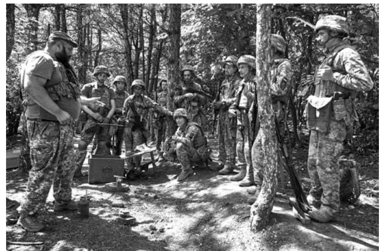
Nuteistuosius kariškiai moko kovos paslapčių.