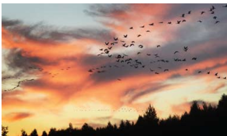
Traukia į šiltuosius kraštus.