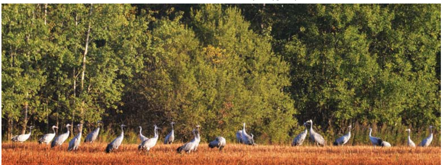
Ankstų rytą gervės maitinasi šalia miško esančiuose ūkininko laukuose.