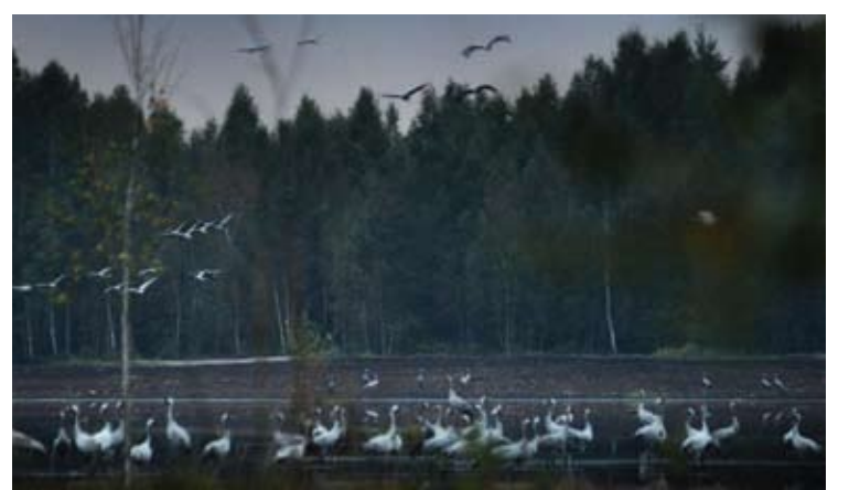
Prieš keletą metų Dabužių durpyno gilumoje teko matyti šimtus nakvojančių gervių.