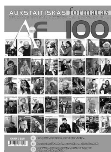
100-ojo žurnalo „Aukštaitiškas formatas“ numerio ieškote prekybos vietose.