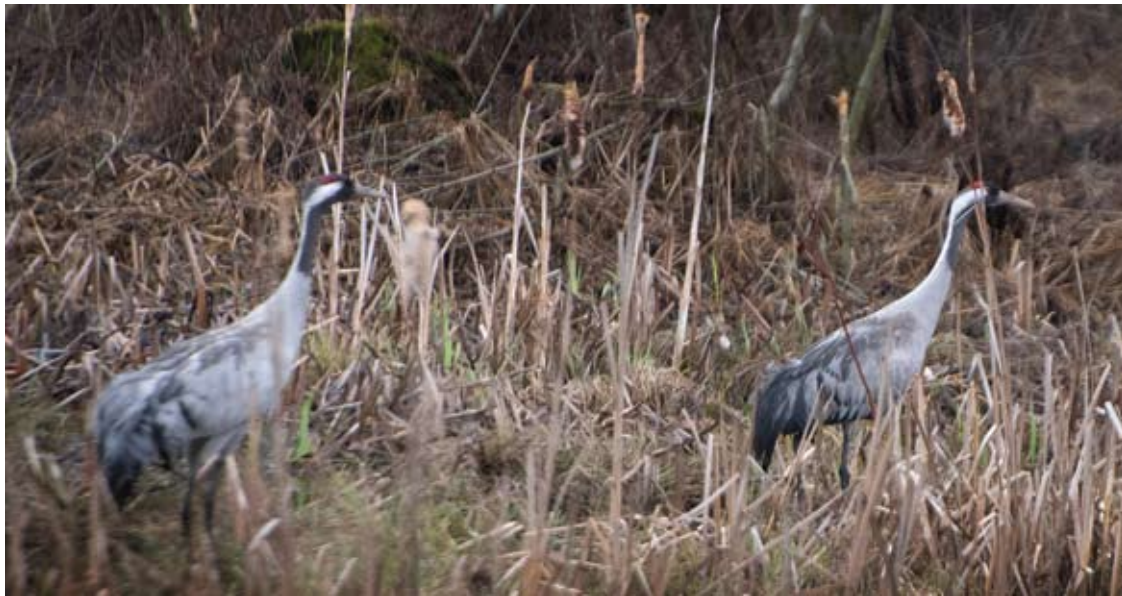
Tautosakoje, įvairiose kultūrose dėl paslaptingo gyvenimo būdo gervės siejamos su ilgaamžiškumu, išmintimi ir sėkme.

Į Lietuvos Raudonąją knygą 1976 metais įrašyta (Lietuvoje perėjo vos keli šimtai porų), 2019 metais iš jos išbraukta, gervė nūnai paplitusi visoje Lietuvoje, jų šalyje peri gerokai per dešimtį tūkstančių porų.